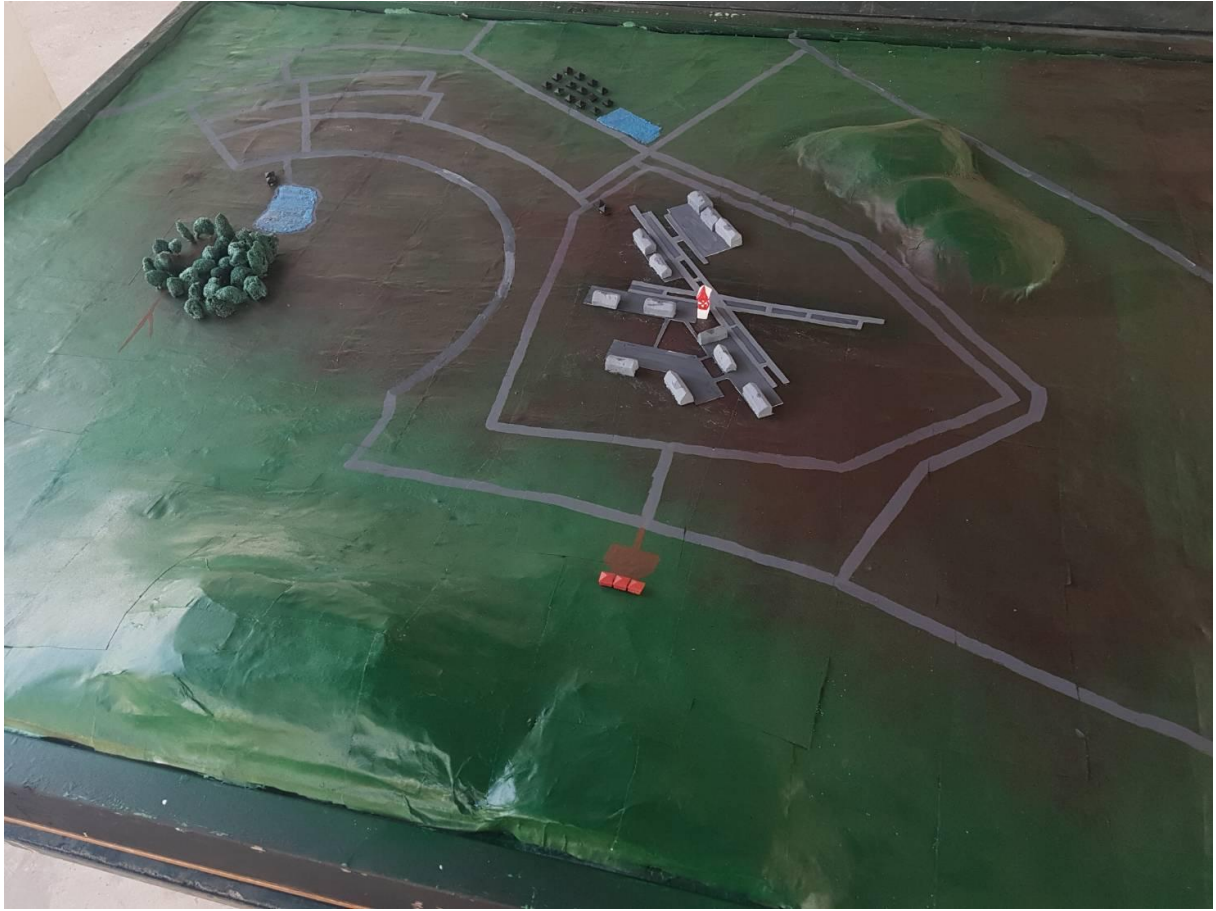
ภาพตัวอย่าง ภูมิประเทศจำลอง